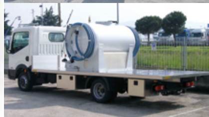
CASSONE FISSO PIANALATO IN ACCIAIO INOX