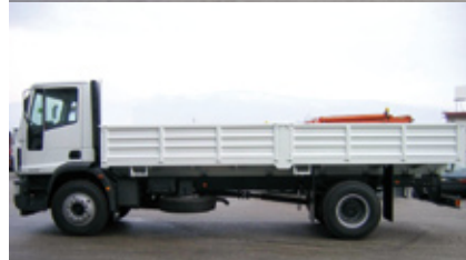
CASSONE FISSO APERTO CON SPONDE IN FERRO