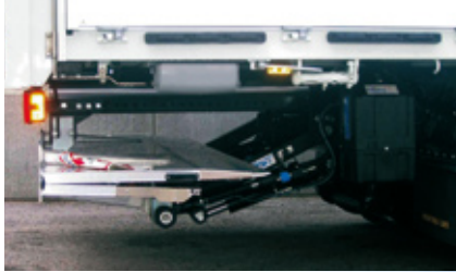
SPONDA MONTACARICHI RETRATTILE, A BATTENTE ED INTERNA