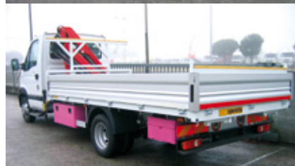
CASSONE FISSO APERTO CON SPONDE IN ALLUMINIO